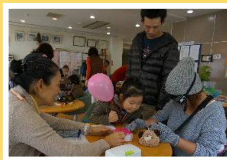
おとしより体験 財布からお金を出しています