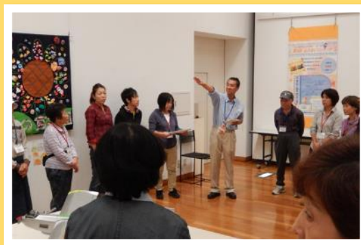
作業内容を共有し、展示作業をスタート