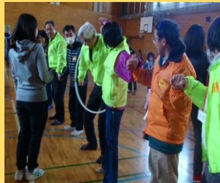
リレー(フラフープくぐり)