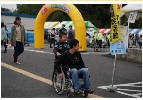
車いす体験 声かけや自走も体験