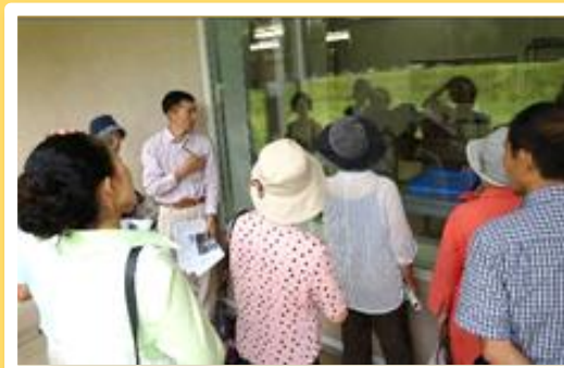
香取神宮内を散策