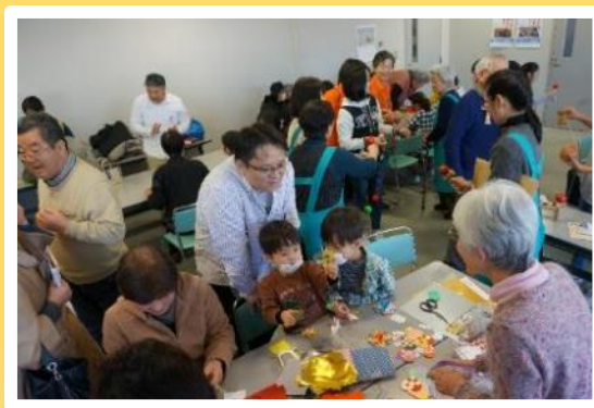
体験タ～イム! の様子