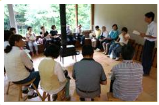
恋する豚研究所による研修