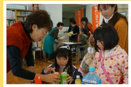
ユニバーサルデザインの紹介