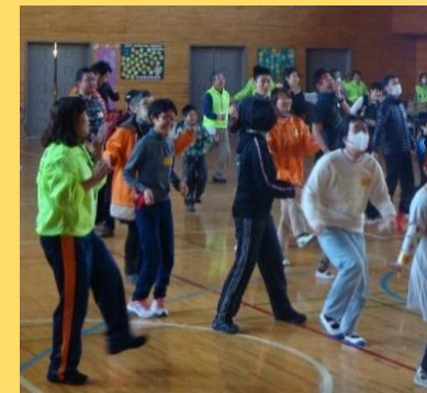
みんなで踊りましょう♪ (踊るポンポコリン)