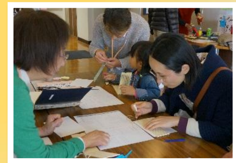
点字を打ってみよう!